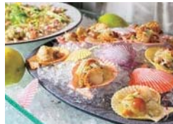
広島県産レモンをたっぷり絞って食すシーフードマルシェ。

大人3,900円(土・日・祝は4,200円)、 6~12歳1,900円(土・日・祝は2,100円)、 4~5歳1,000円