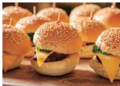
塩麴で練ったオリジナルパティを使った、ミニサイズのバーガー。

ジャンルにとわれない多彩なメニューがそろったbuffet。野菜がたっぷり摂れるのもうれしい。事前に予約をして訪れるのがベターだ。