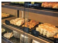
フォカッチャやパン・オ・フリユイなど、パンも豊富にそろおう。