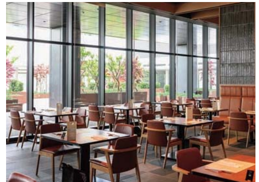
ウッドデッキ広場を望む大きな窓から、明るい光が差し込む店内。広島駅の喧騒を忘れてゆっくり過ごせる。