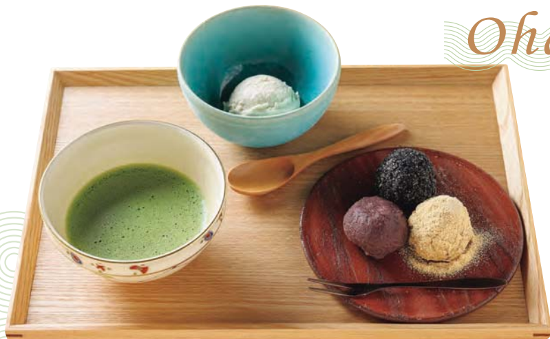
安堵の彩り抹茶セット 1,400円

ミニおはぎ3種類、宇治抹茶、自家製アイスのセット。+300円でアイスをミニパフェに変更することもできる。