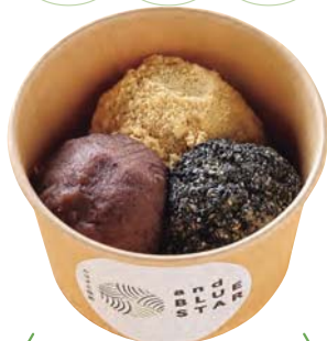
3種のひとくちおはぎカップ 550円

あずき、きなこ、黒ごまの3種類のひとくちおはぎをカップに詰めた持ち帰り用の商品。生クリーム付き650円もあり。