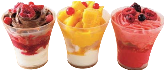
ジェラートプレミオ 650円

左から、チョコレートラズベリーとミルク、マンゴパッションとミルク、ストロベリーとラズベリー。