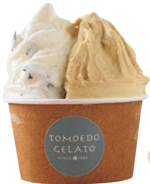
ダブル(レギュラーフレーバー) 550円

写真はストラッチャテッラとキャラメル。フレーバーは日によってラインアップが変わる。