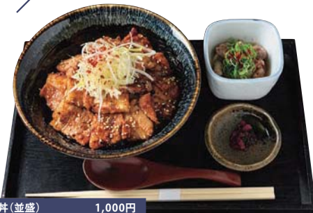
豚丼(並盛) 1,000円 (ランチタイム限定価格)