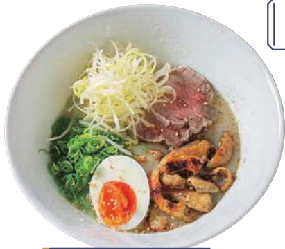
完膚なき豚足らーめん 900円

コラーゲンたっぷりのスープは、ごくごく飲める。香ばしく焼いた豚ホルモンなどトッピングとの相性も抜群。