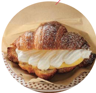
クリームクロワッサン 330円

サクサクのクロワッサンに、自家製カスタードクリームと生クリームをたっぷり詰めた食べ応えのある一品。