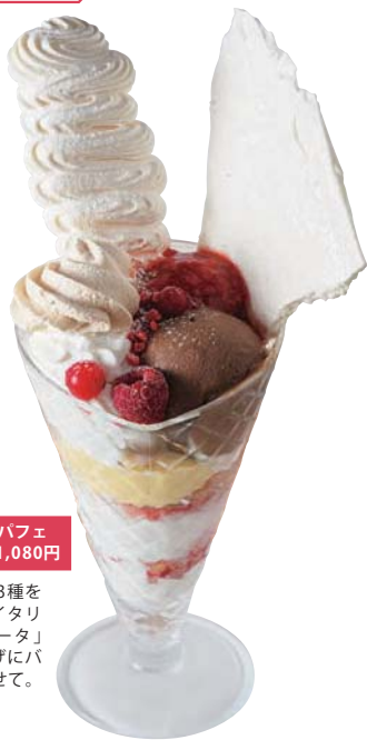
選べるジェラートパフェ 1,080円

好きなジェラート3種を選べるパフェは、イタリア菓子「メリンガータ」をイメージ。仕上げにパニラメレンゲをのせて。