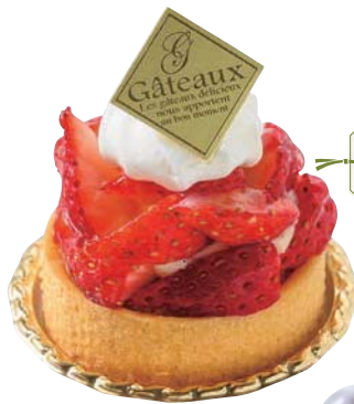
いちごのタルト 509円 (テイクアウトの場合500円)