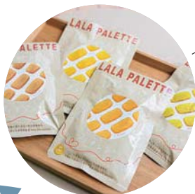
濃厚な味わいで長期保存可能なフィンランシェ各種680円