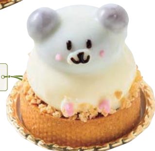
ララちゃん 550円 (テイクアウトの場合540円)

タルト生地の上に、チョコムースとパバロアで仕上げた可愛らしいクマのララちゃんが。