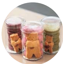
クマ型クッキー入りの円筒タイプは贈り物にオススメ。