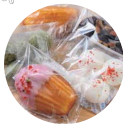
種類豊富な焼き菓子からお気に入りを見つけて。

タルト生地の上に、チョコムースとパバロアで仕上げた可愛らしいクマのララちゃんが。