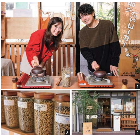
1.手焙煎コーヒー体験教室は、1人3,850円(2日前までの予約制、日程は予約時に応相談)。焼ける豆の香りに癒やされる時間もまた特別なひととき。2.2016年にオープンした店。3.コーヒー生豆の販売も行う。