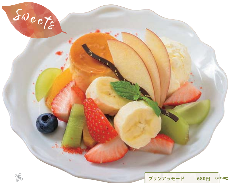
プリンアラモード 680円