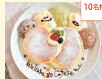
Cafe MaKaNa 500円分お食事券