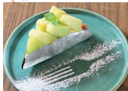
ちょこっとスイーツ 480円

ショーケースから選べるケーキは日によって品ぞろえが変わる。テイクアウトでの利用も可能。