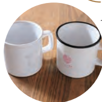
オリジナルマグカップ 各1,650円

日の光が差し込む温かな雰囲気店内でゆったりとランチやカフェを楽しんで。ギャラリーで様々な作家作品と出合えるほか、2階はレンタルスペースとして利用できる。