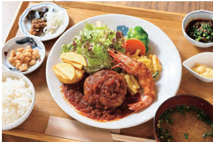
ベジポ特製ハンバーグ定食 1,980円

1時間以上炒めたタマネギを寝かせ、2日かけて仕上げる自慢のハンバーグは、蒸込みトマトソースか和風BBQソースを選べる。