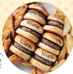
BURGER COMBO (6 cut) / 2,500円

石見ボークを贅沢に厚切りで使用したカツサンドは、ホームゲーム開催日に5食限定で登場(要予約)。