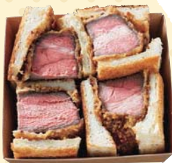
石見ボークの勝つサンド / 1,980円

石見ボークを贅沢に厚切りで使用したカツサンドは、ホームゲーム開催日に5食限定で登場(要予約)。