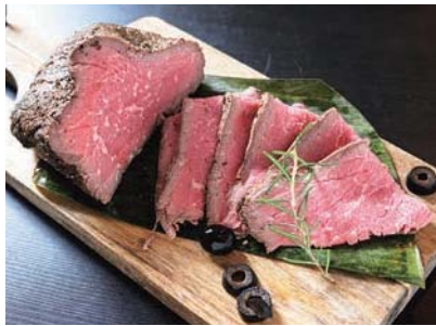
自家製ローストビーフ／880円