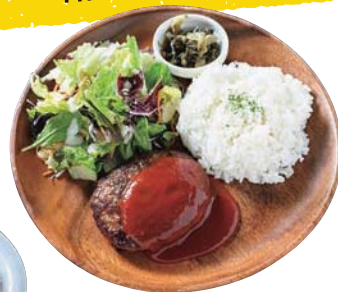
ハンバーグプレート / 650円