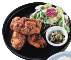
唐揚げ定食 / 650円 スパイスのきいた唐揚げもリーズナブルに楽しめる!

バーガーとフライドチキン、フライドポテトの賑やかなセットは、パーティーなどにも◎(要予約)。