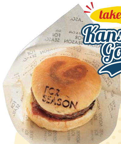
IN HAND BURGER / 400円 ホームゲーム開催日限定のお手軽バーガーは、オリジナルソースかてりやきソースを選べる。