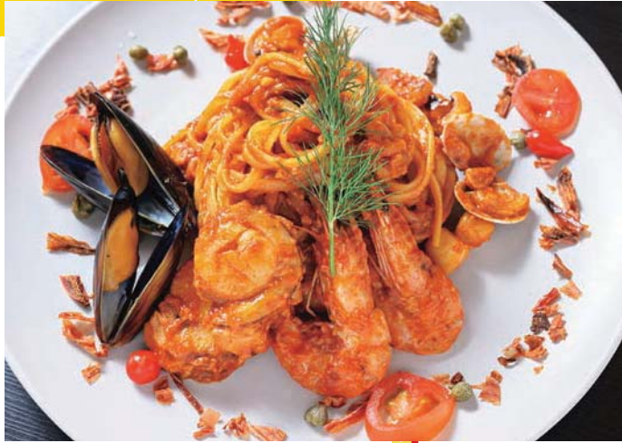
パスタ・レ・ロッシ／ 1,540円