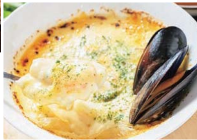
海老と帆立のシーフードグラタン／ 990円