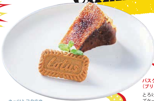
バスクチーズケーキ (ブリュレ) / 700円 とろける食感のバスクチーズケーキは食後やカフェタイムにぜひ。