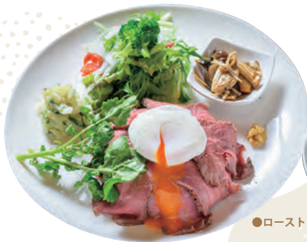
●ローストビーフ丼プレート 1,480円

ご飯の上になっぶり盛り付けたローストビーフは、ポーチドエッグの黄身と甘めの醤油だれを絡めながら召し上げ。