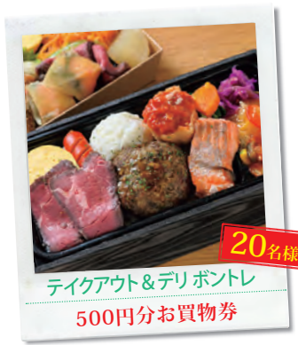
20名様 テイクアウト&デリポントレ 500円分お買物券

今月は神辺エリアの気になるスポットを体験できる、素敵なプレゼントをご用意しました。※写真はイメージです。