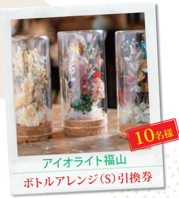
10名様 アイオライト福山 ボトルアレンジ(S)引換券