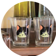
可愛い猫モチーフのアイテムも要チェック!