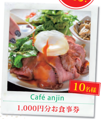
10名様 Café anjin 1,000円分お食事券