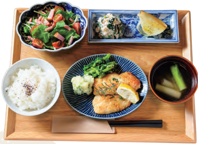
●週替わり・あんじんで飯 1,480円

メイン料理に副菜3種とスープが付いたセット。地元産の野菜や、神石高原町産のコシヒカリを使用する。