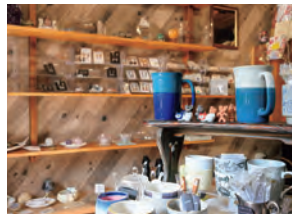
店の裏手には、小さな蔵を使った雑貨ショップ『SuKuRu』もあり。天然石や日用雑貨などを購入できる。