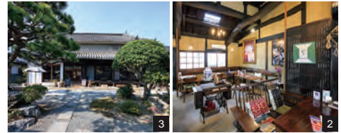
1.2.地元産の琴を椅子の背もたれにするなど、古い家具や廃材を生かした店内。無料Wi-Fiや一部の席にコンセントを準備しており、様々なシーンで利用できる。店内ではイベントやワークショップも随時開催。3.テラス席や縁側はペット連れもOK。