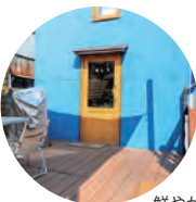
鮮やかなブルーの壁が印象的な雑貨ショップ入口。