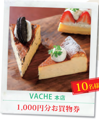
10名様 VACHE 本店 1,000円分お買物券