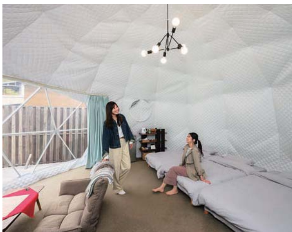
専用BBQスペースを備えた、ドームテントは素泊まり1泊25,600円～(2名1室の場合)。ペット同伴可能なコテージもあり。