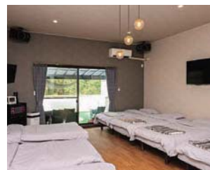
カラオケ付きのコテージもスタンバイ。日帰りの利用も可能だ。