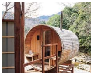
バレルサウナ(予約制)5,000円では、清流を眺めながらとこのうことができる。

自然を感じながら非日常の時間を満喫できる宿泊。1部屋で最大10名まで泊まることできる。