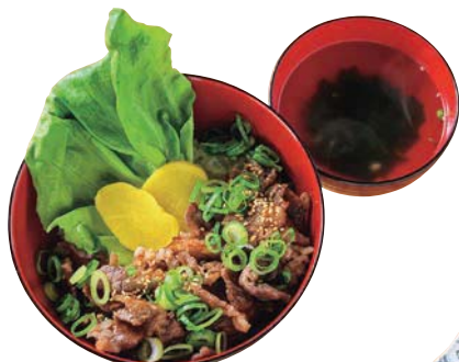
和牛特上カルビ丼 800円 宮崎県産黒毛和牛を贅沢に使った、食べ応えのあるカルビ丼。

カレーライス450円、ピザ550円など、手頃な価格設定もういしいカフェでの食事や休憩もぜひ。