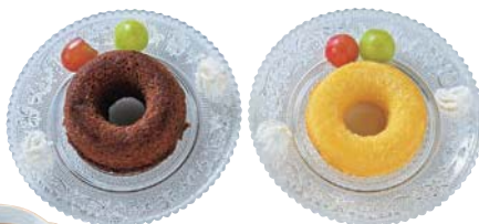
ドーナツ各280円、ブレンドコーヒー400円 ドーナツやレモンケーキなどのおやつメニューも用意。