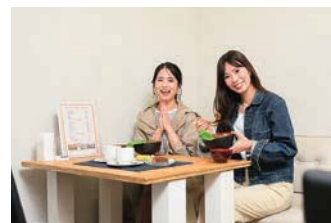
テーブル席とカウンター席を備えたカフェの店内。フードやドリンクはテイクアウトも可。