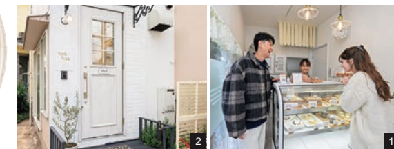
1.弁当は売り切れ次第終了。電話で取り置きもできるのでぜひ利用して。2.可愛らしい入口が目印。2024年11月でオープン3周年を迎えた。

※『ネットヨタ広島』の最寄り店舗は「五日市店」。こちらでは1/18(土)、19(日)にイベントを開催予定！詳細は次ページへ。