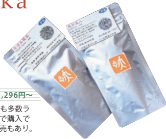
中国茶・台湾茶 1,296円～

自宅で楽しめるお茶も多数ラ インアップ。お試しで購入で けるミニサイズの販売もあり。