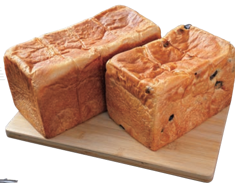
口だけ芳醇 890円 溢れる葡萄 950円

広島市佐伯区隣の浜1-2-30 ☎080-3556-0210 図10:00~17:00 ※売切れ次第終了 図日・月・祝、12/28~1/6 図1台