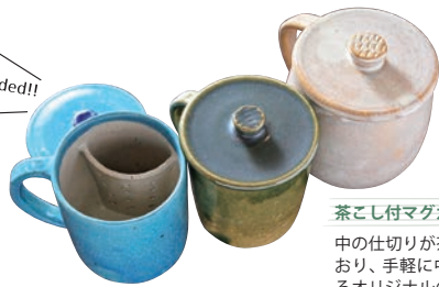
茶こし付マグカップ 4,950円～

中の仕切りが茶こしになって おり、手軽に中国茶が楽しめ るオリジナルのマグカップ。