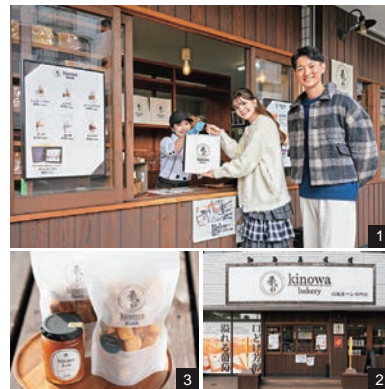
1.2.オープン以来多くの人に愛され、定期的に通うリピーターも多い。3.パンと一緒に味わいたいオリジナルのジャムや、シュガーバター、ガーリックパザルなど5種類がそろうラスクも人気。