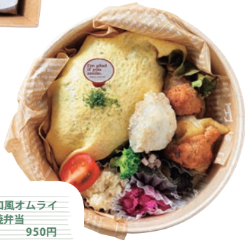
高菜とじゃこの和風オムライスと鶏の明太子焼弁当 950円