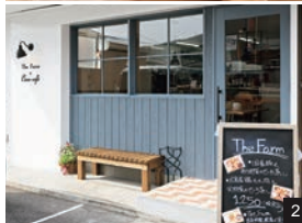
1.子ども限定の小さなせいろ蒸し定食770円。キッズ用のチェアも用意する子連れに優しい店。2.今年3月にオープンした店。3.カウンター3席、テーブル12席の店内。