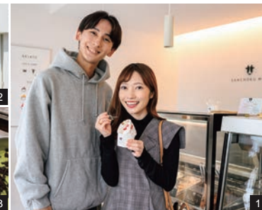
1.2.2023年9月にオープンした店。店の外のベンチに座って味わうのもOK。3.ジェラートのフレーバーは日によって変わる。広島県産食材も積極的に使用。