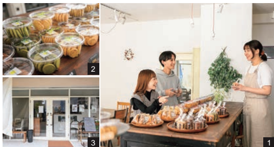
1. 落ち着いた雰囲気店内でシフォンケーキなどのスイーツやドリンクを召し上げ。2. 13種類ほどをスタンバイするクッキーは、チョコレートやキャラメルアーモンド、ほうじ茶など種類豊富。3. 店内では古いカフェなどのイベントも実施する。