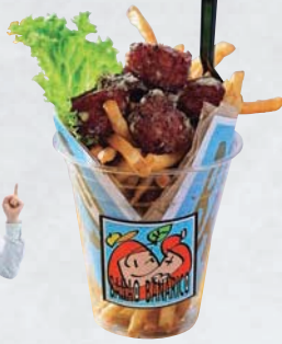
からしマヨトン 800円

カラッと揚げたフレンチフライと、ポークソーセージを辛子マヨネーズで和えた品と一緒に。