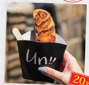
チョコ届(ギフト) 生チョコソフト引換券