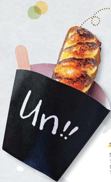
釜焼き芋のプリュレ 650円

ねっとり甘い芋と、甘さ控えめのクリームのバランスが程よい、人気ナンバーワンメニュー。