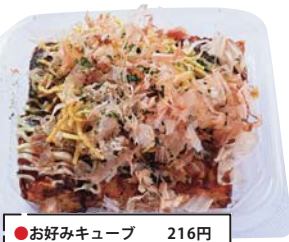
●お好みキューブ 216円

キャベツ、紅ショウガ、焼そばをすり身に練り込んだ、オリジナリティあふれる広島らしい商品。