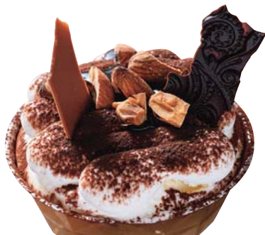
●ティラミスマスカルポーネ 530円

1.ショーケースに並ぶケーキの数々からお気に入りを見つけて。2.住宅街の一角に行むお店。3.福岡県・八女産の抹茶とベルギー産のホワイトチョコを使用した、しっとり食感の抹茶ちょこホワイト(ホール)1,550円も人気。