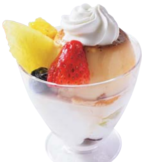
●プリンアラモード 600円

プリュレ風のとろりとした食感のプリンを、季節のフルーツ、チョコレートスポンジと一緒に。