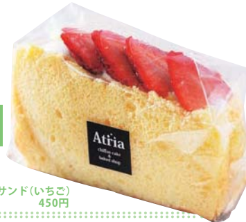
フルーツサンド(いちご) 450円