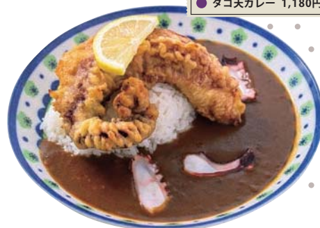
● タコ天カレー 1,180円