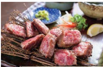
● 埴下牛三角バラ肉炭火焼き 1,400円

美しいサシが入った柔らかくなくちどの(埴下牛)。塩だれ、刻みわさび、醤油をお好みで。