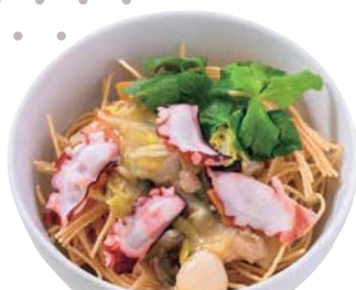
● 三原タコのルマーダ風うどん 880円