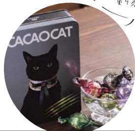
● <CACAO CAT>チョコレート 950円/100g

新鮮な魚介類をたっぷりのせた海鮮丼。安芸高田市「向原農園」の卵「彩」の濃厚な黄身を混ぜながらどうぞ。