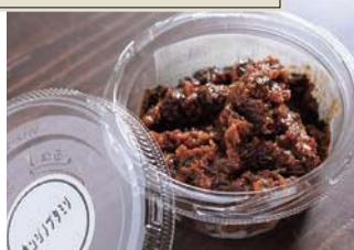
● 自家製豚味噌 450円/100g