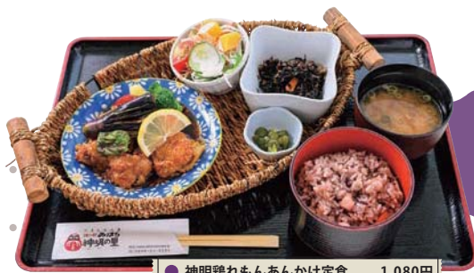
● 神明鶏れもんあんかけ定食 1,080円

レシビコンテスト最優秀作品をメニュー化。甘酸っぱいレモンの風味が鶏肉によく合う。