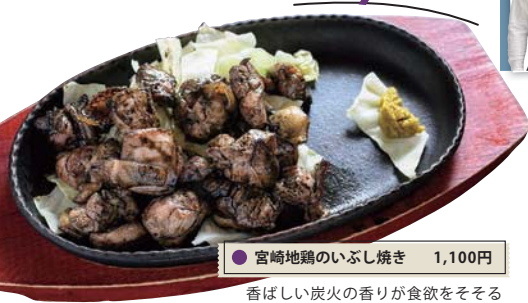
● 宮崎地鶏のいぶし焼き 1,100円