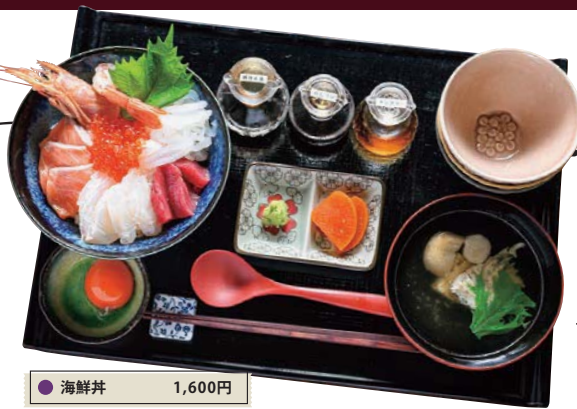
● 海鮮丼 1,600円

美しいサシが入った柔らかくなくちどの(埴下牛)。塩だれ、刻みわさび、醤油をお好みで。