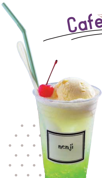
● クリームソーダ 600円