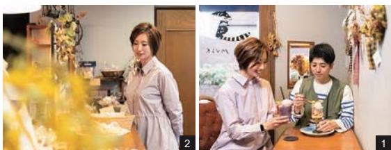
1.展示販売されるドライフラワーがディスプレイされた店内で、見た目も華やかなデザートの数々を。2.尾道ドライブの途中にほっと一息つく時間を過ごせる空間。

◆キウイのヨーグルトフラッペ 800円(テイクアウト限定) キウイとヨーグルト、ハチミツレモンゼリーの爽やかな酸味の組み合わせを味わう、初夏にぴったりの一品。