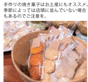
手作りの焼き菓子はお土産にもオススメ。季節によっては店頭と並んでいない場合もあるのでご注意ください。

◆ユニコーンレモンフロート 816円 バターライビーのシロップを加えたハーブティーのティーソーダに、2種類のグレープフルーツ、レモンとレモングラスのソルベを加えたドリンク。