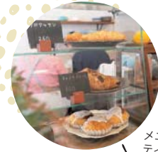
メニューはテイクアウトもOK♪