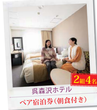
呉森沢ホテル 2組4名様 ペア宿泊券(朝食付き)