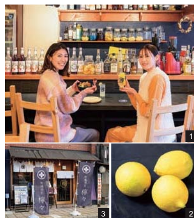
1.カウンター席とテーブル席を備える店内。2.安心・安全なレモンを使った品々を。3.ランチタイムには、事前予約でちょっと贅沢な御膳メニューもオーダーできるので、特別な日に利用するのもオススメです。

呉市の蒲刈や大長産のレモンを使ったメニュー を豊富に楽しめる1軒。ランチタイムは、レモン 果汁でさっぱりと味わえる鶏の唐揚げレモン油 淋鶏丼や、自家製レモンポン酢で食べる塩カツ定 食など、自慢のレモンをアクセントに使用した品 々を用意する。レモンカッシュや蜂蜜レモンジ ンジャーといったノンアルコールドリンクも種類 豊富なので、ぜひ一緒にオーダーして楽しみたい。