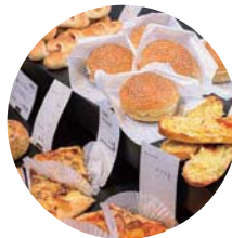
定番だけでなく、期間限定のパンもチェック♪