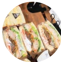
サンドイッチ類も豊富にスタンバイ！