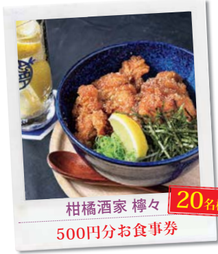
柑橘酒家 檸檬々 20名様 500円分お食事券