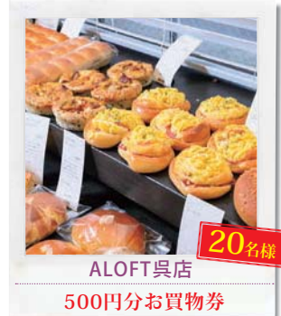
ALOFT呉店 20名様 500円分お買物券