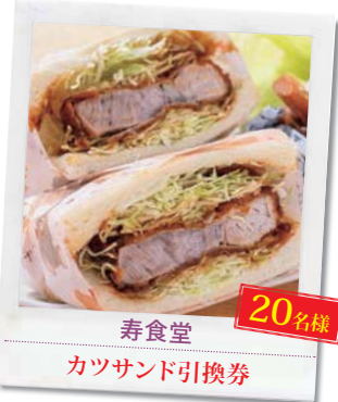
寿食堂 20名様 カツサンド引換券