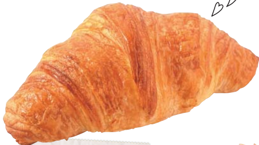
プレミアムクロワッサン 259円

クロワッサン生地をマフィンのように焼き上げた見た目も可愛い一品。中にはイチゴクリームをたっぷり。