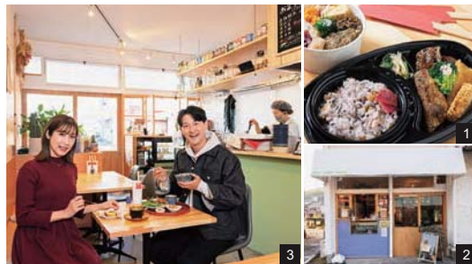
1.一膳弁当500円などの弁当類も販売。2.店頭で購入できる一人暮らしの人にもうれしいカップデリは1品100円〜と手頃。3.土・日のみ、予約制で夜営業もおこなう。

管理栄養士の資格を持つ店主による、栄養バランスのとれたランチやいつもの食卓にプラスできるデリを楽しめる1軒。ランチの定食は、汁物と3つのおかず、雑穀米を組み合わせた一汁三菜の内容で提供する。また、持ち帰り用のカップデリは、13~15種類をスタンバイ。好きなおかずをちょっとずついろいろ選べるのがうれしい。他に、家庭で楽しめる豆乳で仕上げた冷凍グリーンカレーも要チェック!