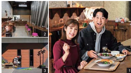
1.2.個性的な内装がインパクトのある店内には、カウンター席をスタンバイ。カレーの他に、鹿肉を使った汁なし担々麺などもあり。3.店頭では多肉植物の販売もおこなう。

「栄養たっぷりの鹿肉の魅力を知ってほしい」と、2022年春にオープンしたジビエ料理専門店。看板メニューのカレーパンは、東広島産の本州鹿と北海道産のエゾ鹿の2種類の熟成鹿肉にたっぷりの黒ゴマを加えてコクを出した特製のカレーを、三原市『ムカイ製パン』に特注したベーグルにつけながら味わう独自のスタイルで提供する。ジビエ特有の臭みがなく食べやすいので、初めての人にもオススメです。