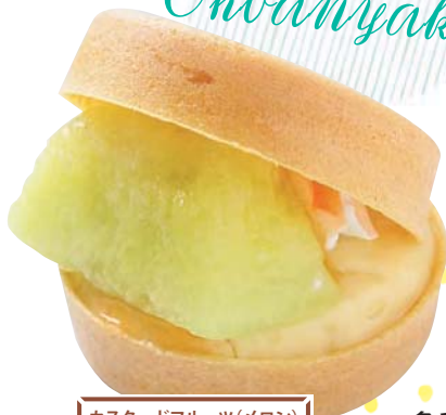
カスタードフルーツ(メロン) 220円

カスタードクリームとフルーツの組み合わせが人気のシリーズ。7月は芳醇な香りのメロンが登場。