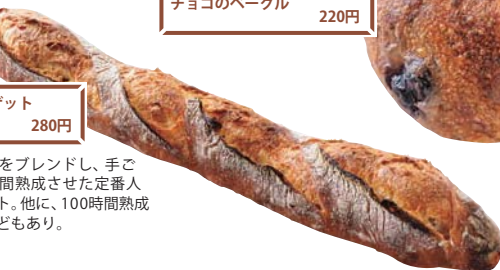
レトロバゲット 280円

国産小麦粉をブレンドし、手こねして長時間熟成させた定番人気のバゲット。他に、100時間熟成バゲットなどもあり。