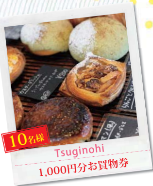
10名様 Tuginohi 1,000円分お買物券