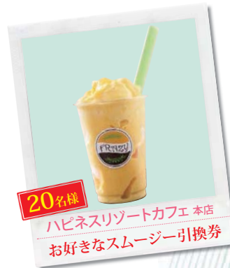
20名様 ハピネスリゾートカフェ 本店 好きなスムージー引換券