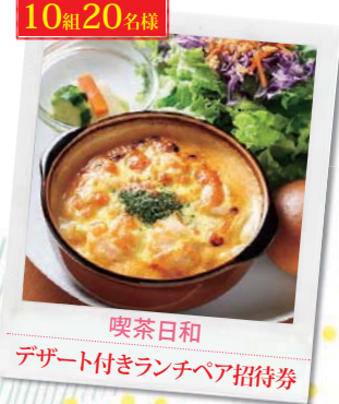
10組20名様 喫茶日和 デザート付きランチペア招待券