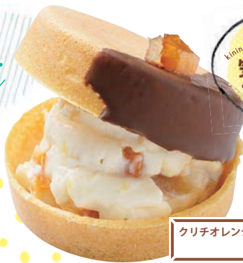
クリチオレンジピール 220円

カスタードクリームとフルーツの組み合わせが人気のシリーズ。7月は芳醇な香りのメロンが登場。