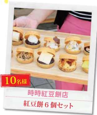
10名様 時時紅豆餅店 紅豆餅6個セット