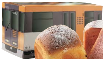
幸せのアストラム ラインパン 各237円

生地に練りこんだ素材の風味を味わえる一品。2個購入でアストラムラインの箱がついてくる。