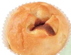
あっふるバター&しなもん シュガー 270円