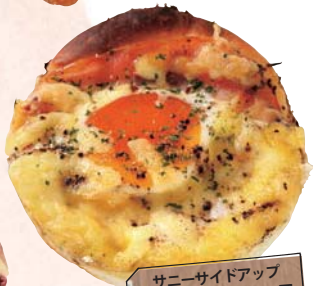
サニーサイドアップ 280円