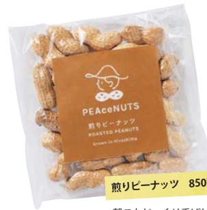
煎りピーナッツ 850円

殻ごとじっくり香ばしく煎ったオリジナルの落花生。通常の落花生の倍ほどの大きさで食べ応え満点だ。