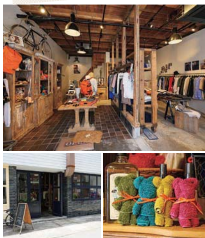
ゆっくりと洋服選びができる店内。隠し扉の奥には〈THE SUPERIOR LABOR〉専用のスペースもあり。