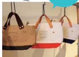
(THE SUPERIOR LABOR) トートバッグ 8,800円など。