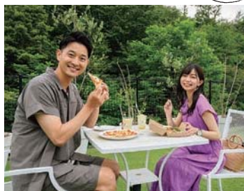
テラス席で緑を眺めながらカフェタイムを過ごすのもオススメ。