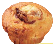
PEAcE NUTSバターと 世羅苺のマフィン 350円

この日の内容は、タコライス、アスパラガスの揚げピザ、わかめと小松菜の出汁浸し、ほうれん草のミートボール。