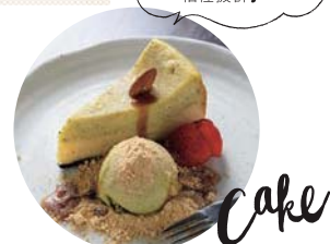
ピスタチオとアーモンドのチーズケーキ650円は、ピスタチオペーストを贅沢に使用した濃厚な味わいの一品。

呉市中通3-1-4 オーシャン10ビル1F ☎0823-43-1558 🕒11:30~17:00 (L.O.16:30) 🔥・水 📍近隣のコインパーキングを利用