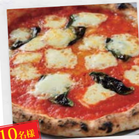
Pizzeria la Vita