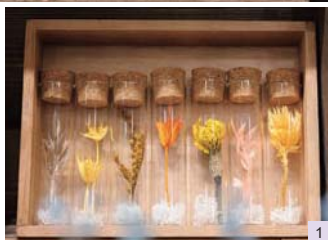
1.手軽に飾れるフラワーミニボトル各440円。 2.ボトルアレンジ(M)3,850円ほか、オリジナルのアレンジメントも豊富に用意。密閉されているため鮮やかな花の色が長く楽しめる。