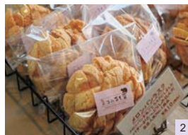
1.カウンター席とテーブル席を用意する店内。2/バターがたっぷりしみ込んだメロンパンラスク410円。