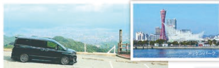
六甲山からの景色