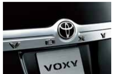
バックドアガーニッシュ（車名ロゴ・スモークメッキ）