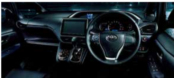
VOXY特別仕様車ZS“煌”（ベース車両はZS（7人乗り・2WD））。内装色はダークブルー&ブラック。