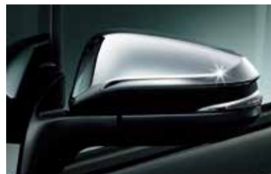
オート電動格納式リモコンドアミラー（助手席側アスファルトミラーサイドターンランプ付）[メッキ]