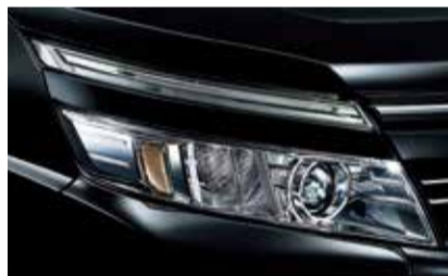
LEDヘッドランプ（オートレベリング[ロービーム]機能付）+LEDクリアランスランプ[メッキ]