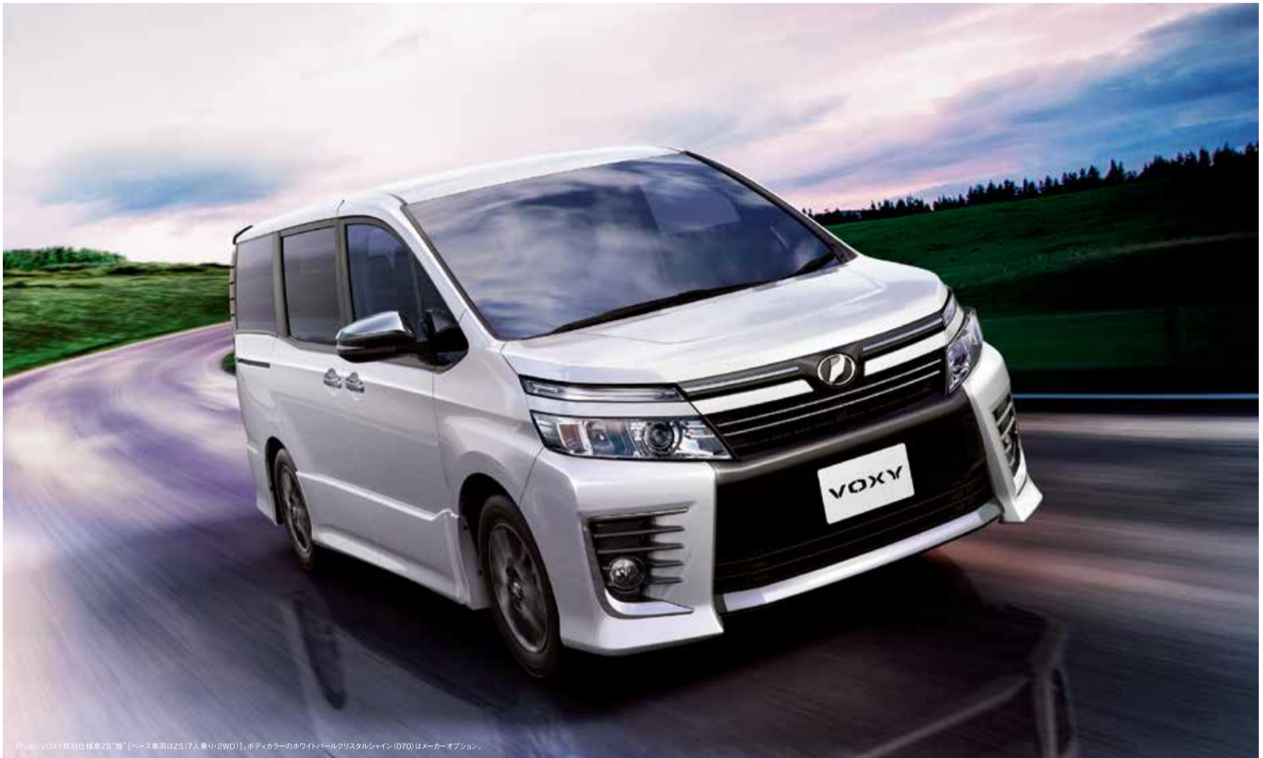
Photo: VOXY特別仕様車ZS“煌”（ベース車両はZS（7人乗り・2WD））。ボディカラーのホワイトパールクリスタルシャイン（070）はメーカーオプション。